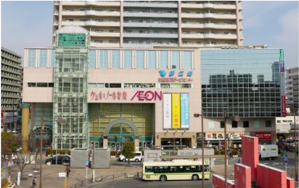
写真：布施駅前市街地再開発ビル・駅前広場